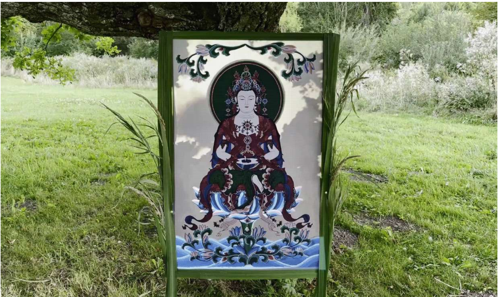
tableau taengwha augmenté